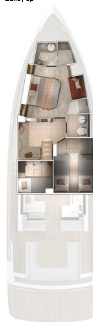
Lower deck Galley up