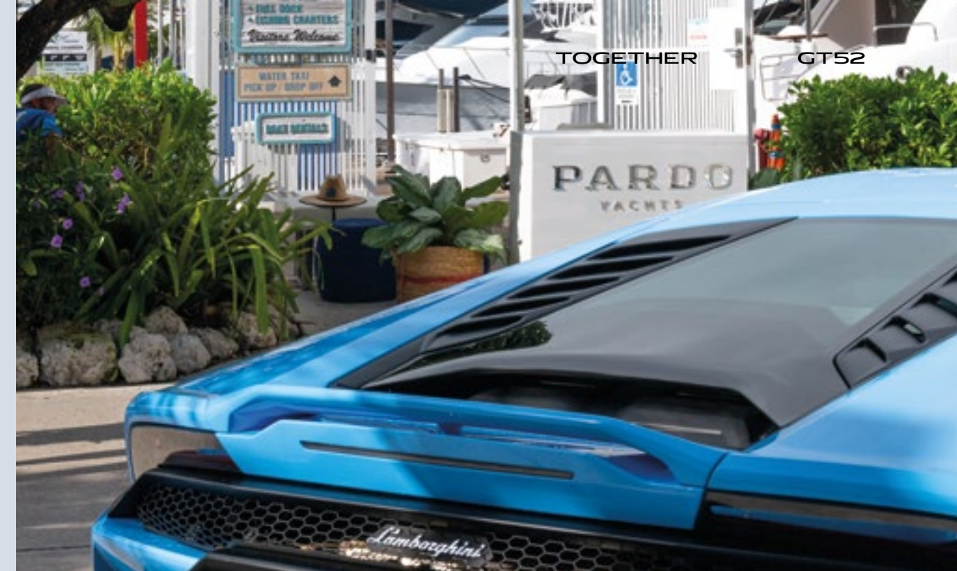
MIAMI - PARDO YACHTS & LAMBORGHINI