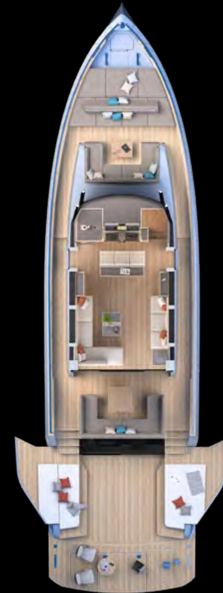
Main deck Beach Version